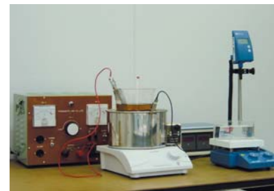
ハルセル試験装置(めっき浴の濃度測定)