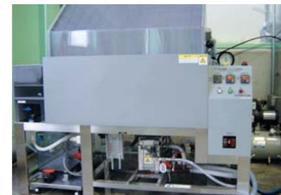
塩水噴霧試験装置(耐食性試験機)