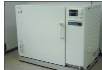
精密恒温装置(耐熱性試験)