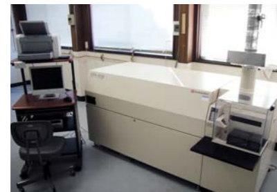
ICP発光分析装置 (微量元素の高精度成分分析)